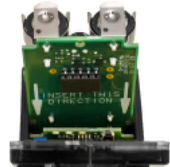
Placa de batería Q45