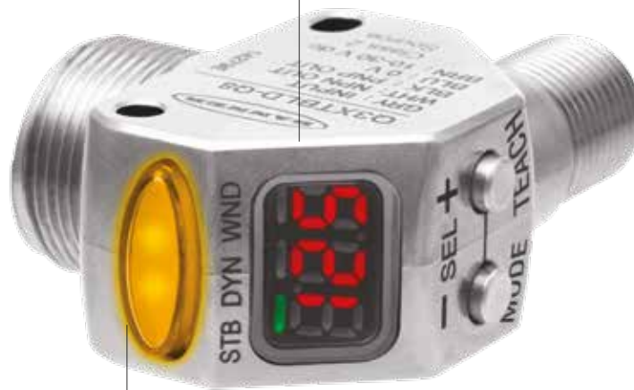
니켈 도금 이연 하우징