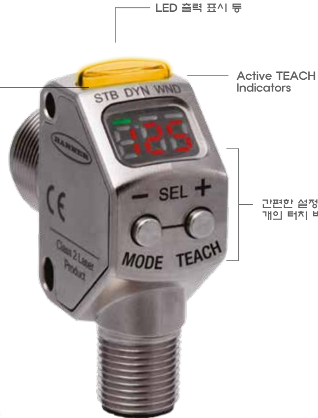
LED 출력 표시 등