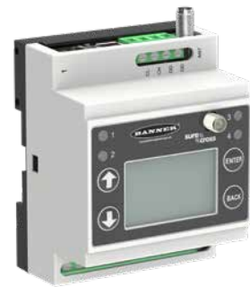
DXM Modbus Gateway