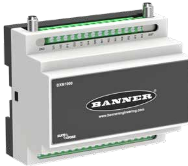
DXM Modbus Slave Cihazı