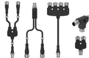
Divisores y uniones en T M12