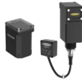
Sensor de vibración y temperatura QM30VT