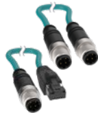
Cables conectores M12 macho de 4 pines y doble terminación y M12 macho de 4 pines a RJ45 para Ethernet