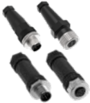
Cableados en campo M12