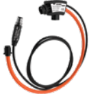
Sensor de corriente de bobina Rogowski S15S