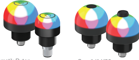
K50 Dokunmatik Buton