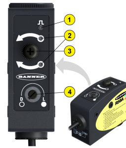
Abbildung 1. Merkmale

Die hohe Schaltfrequenz von 10 kHz und die Wiederholgenauigkeit von 15 µs garantieren zuverlässigen Betrieb bei hoher Ansprechgeschwindigkeit. Es sind Ausführungen mit parallelem oder senkrechtem Erfassungsbild sowie mit 20-ms -Aus-schaltverzögerung für eine Vielfalt von Anwendungen erhältlich. Das robuste Gehäuse aus Zink-Druckguss und die hochwertige Acryl-Linse sind beständig gegen Elektroräuschen und Vibrationen von Pressen und Stanzmaschinen.