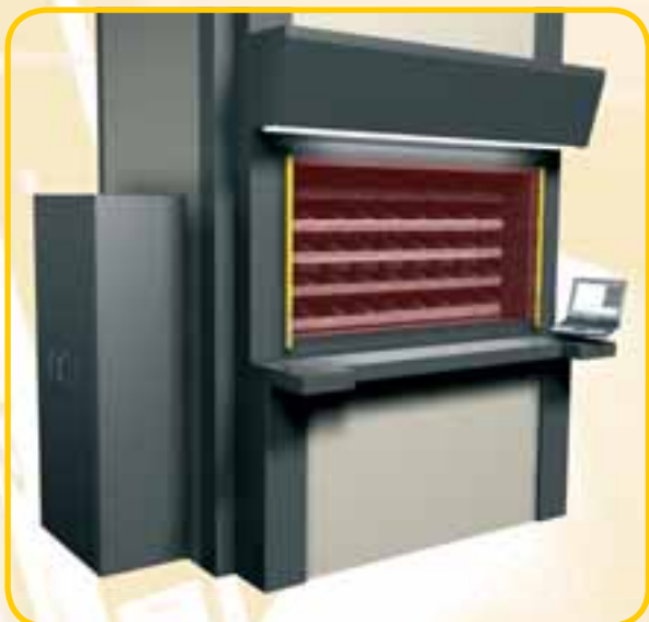
▲ Magazzini verticali