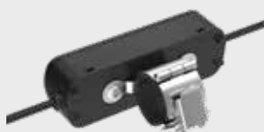
LMBPTL110C 28 mm チューブ式ラック