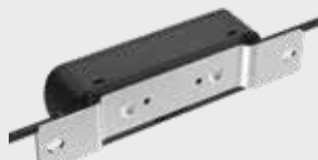
LMBPTL110F スロット付き押出またはフラットレール取り付け