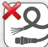
Alternativa al cableado

Se crea una red con autonomía propia para gestionarse por sí misma. Sin límite aparente con el uso de múltiples módulos. Posibilidad de tener diferentes redes trabajando en un mismo espacio sin interferencia entre ellas.