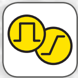
Múltiples Señales, Digitales y Analógicas

Evite dañar cables, cortes o fallos de conexión con una conexión wireless. Evite extra costes debidos al tendido del cableado con soluciones wireless.