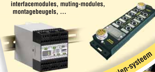
EZ-SCREEN Type 2